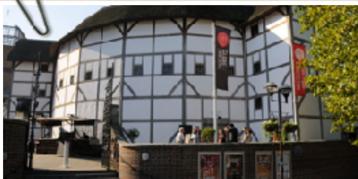
”The Globe” - Shakespeares teater som nu är återuppbbyggd i London