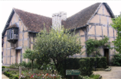
Shakespeares hus i Stratford-upon-Avon