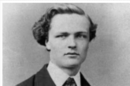
Strindberg som ung