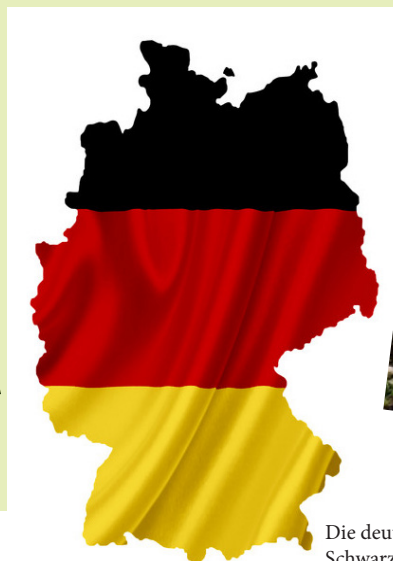
Die deutsche Fahne: Schwarz, Rot, Gold